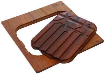
PLANCHE DE DECOUPE DOUBLE IROKO A644 F04