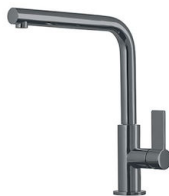
VERONA GUN METAL R497 S56