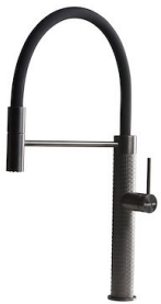
INCISO GUN METAL R424 S56