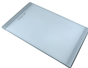
PLANCHE DE DECOUPE CRYSTAL 23x41 CM

* uniquement en combinaison avec l'accessoire A644 F04